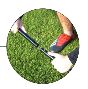
STEP A: CONNECT BASE FRAME TOGETHER