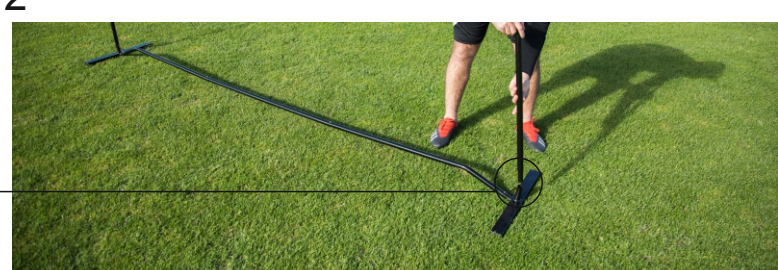
STEP B: ATTACH SINGLE STEEL UPRIGHT TO ASSEMBLED BASE FRAME